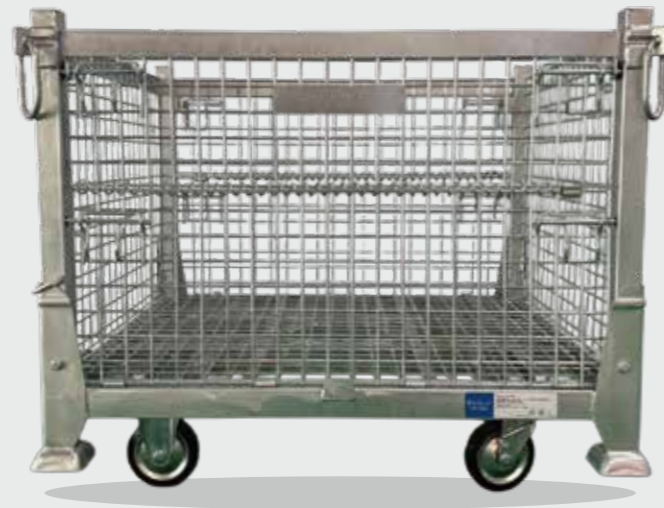
吊パレットタイプ