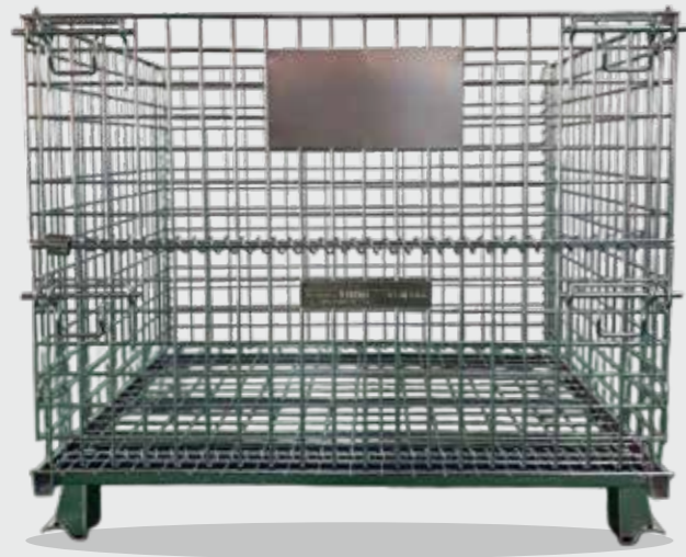
CS メッシュパレット